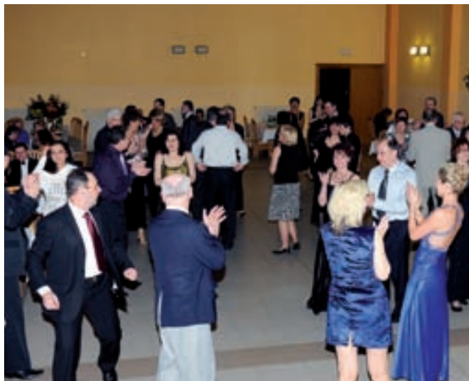
Snímky se vracíme k tradiční akci OHK Brno-venkov – již XIV. Reprezentačnímu plesu, který se 12. února uskutečnil tentokrát v hotelu Gregor v Modřicích.