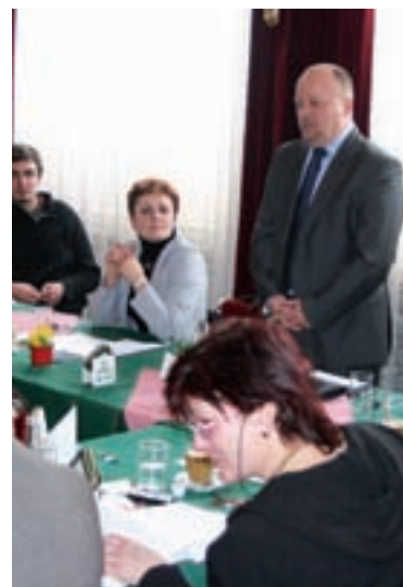
Seminář organizovaný RRA JM - Zásobování pitnou vodou v Jihomoravském kraji, 26. února 2010.

ce Případové studie regenerace brownfieldů seznamuje čtenáře s šesti projekty z různých koutů Česka, které dokumentují proces regenerace ve všech jeho fázích. Autorům byla i tentokrát ku pomoci předem stanovená osnova, která doplňuje vodítko při tvorbě textu. Ne všichni se však s její podobou sžili, a výsledkem je tak pestrá směs svébytně prezentovaných zkušeností, které mají občas poměrně trpkou příchuť. Ze všech příkladů však číší opravdové odhodlání a zapálení pro věc, což jsou pro úspěšnou realizaci projektu předpoklady naprosto nezbytné. Kromě již tradičně preferovaných příspěvků z Jihomoravského kraje jsou v materiálu tentokrát zastoupeny regiony Olomoucký, Ústecký, Zlínský a Hlavní město Praha.