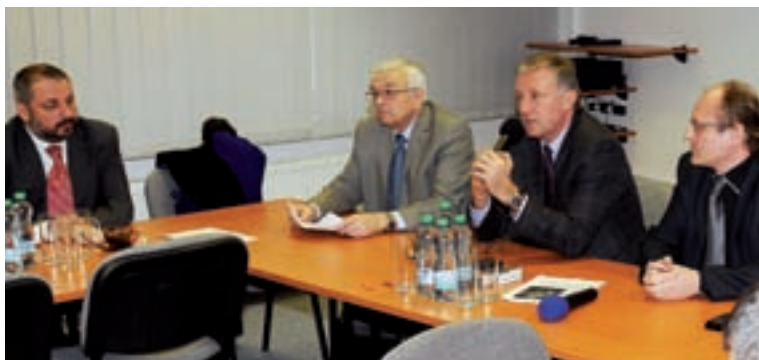
Členové OHK Brno-venkov přivítali 18. února 2010 na besedě k hospodářským tématům Mirka Topolánka.

OHK Brno-venkov rozjíždí vzdělávací projekt v Operačním programu lidské zdroje a zaměstnanost a od dubna 2010 proškolí za evropské peníze zaměstnance v 50 firmách ve 30 vzdělávacích aktivitách. Komora se bude snažit pomoci alespoň touto cestou, a to především stabilním pracovním silám ve firmách v rámci jejich dalšího rozvoje, a tím udržitelnosti na trhu práce.