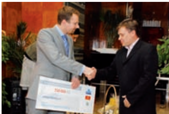
Částku 350 000 Kč získaly Hustopeče na záchranu mandloňových sadů.

Veškeré informace týkající se projektu a problematiky integrace cizinců v Jihomoravském kraji jsou dostupné na nově vzniklých webových stránkách: www.cizincijmk.cz .